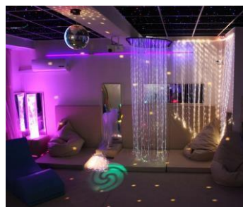
Оборудование для сенсорной комнаты