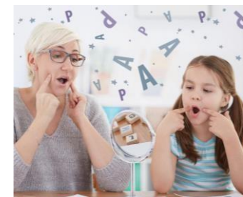
Оборудование для кабинета логопеда