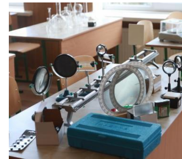
Оборудование для кабинета физики