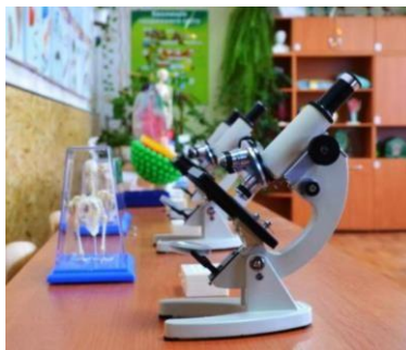
Оборудование для кабинета биологии