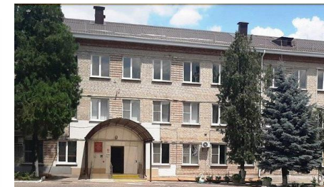
Оснащение мастерской повара в Государственном Общеобразовательном учреждении «Могочинская Специальная (Коррекционная) Школа-Интернат», Забайкальский край г. Могоча

В школу-интернат были поставлены: комплект методических пособий Акименко В.М., программно-аппаратный комплекс "КЛАССИКОР". Оборудование включает в себя не только методические наборы для проведения занятий, но и программы для отслеживания динамики проведенной работы. Также были поставлены наборы психолога «Пертра» и "Классический", способствующие формированию креативности и нелинейного мышления ребенка, его активного и творческого освоения окружающего мира. Также, их можно использовать для коррекционных занятий с детьми, имеющих особые потребности.