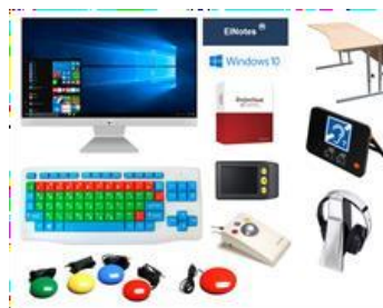
Специализированное оборудование для обучающихся с нарушениями зрения, слуха и ОДА