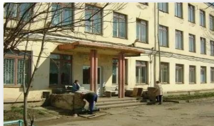
Поставка оборудования для швейной мастерской в «Школу-интернат №1»