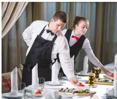
Персонал в сфере обслуживания