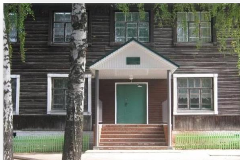
Поставка оборудования для мастерской декоративно- прикладного искусства в ГБОУ «Нартасская школа-интернат», Республика Марий Эл

В рамках проекта было поставлено следующее оборудование для мастерской ДПИ: штангенциркуль цифровой, защитные очки-экран, набор рашпелей, набор резцов по дереву, стол для ученической швейной машины, пресс ручной универсальный, примерочная, станок для бисероплетения, станок для вышивания, набор инструментов для работы с кожей, кроме этого были поставлены: установка гидропонная и стол производственный.