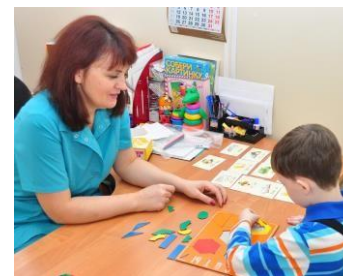
Оборудование для кабинета психолога