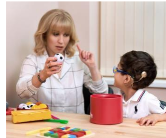
Дидактическое, методическое оборудование для обучения и коррекционно-развивающей работы