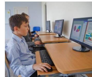
Компьютерное и мультимедийное оборудование