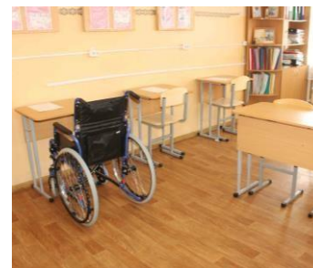
Мебель, в том числе специализированная