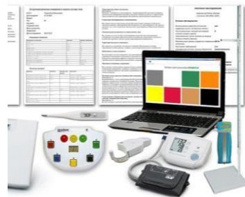
Аппаратно-программный комплекс оценки здоровья учащихся