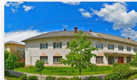
Дооснащение кабинетов логопеда и психолога диагностическим и коррекционным оборудованием в «Адаптированную школу-интернат № 10», г. Чудово, Новгородская область

В рамках проекта нами было поставлено: станки, прессы, растяжки, комплект инструментов и обувная швейная машинка. Всё оборудование соответствует необходимым требованиям и нормам безопасности и подходит для обучения всех категорий учащихся, включая детей с ОВЗ. Под руководством опытного педагога учащиеся школы-интерната осваивают навыки профессии "Обувное дело" и смогут на практических занятиях применять полученные знания: ремонтировать обувь, делать набойки, растягивать колодку и голенище по форме ног и т. д.